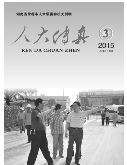
封面图片:5月7日,市人大常委会主任刘明调研我市重点项目建设情况。