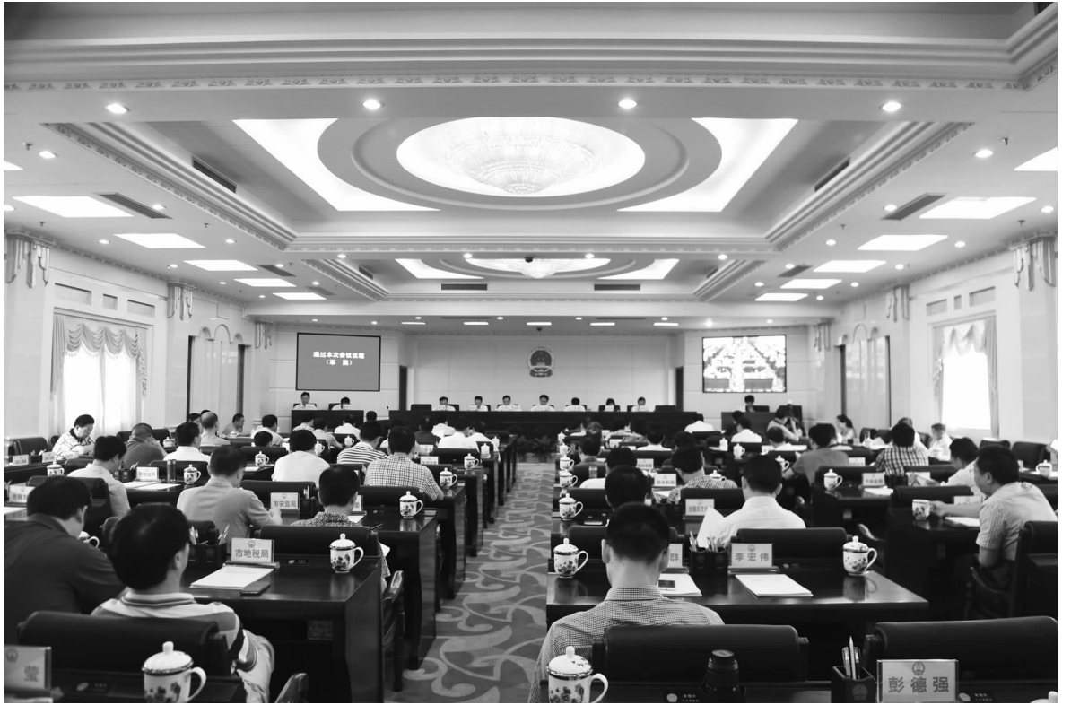
6月29日至30日,常德市第六届人民代表大会常务委员会召开第十八次会议。