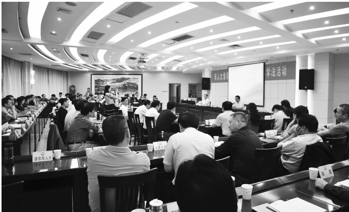
5月29日,市人大常委会开展集体学法活动

2.关于代表资格终止的问题,能否将代表的出口规范化。《代表法》对代表在会议期间的不作为有明确的处理规定,即“未经批准两次不出席本级人民代表大会的,终止代表资格”。但是对代表在闭会期间的不作为没有明确处理规定,不便于实际操作。一些代表也产生了模糊认识:重会议期间的出席,轻闭会期间的参与。实际上,闭会期间的活动同样重要,代表在闭会期间的履职时间更长,在闭会期间的活动,决定着代表会议期间的履职效果。因此,有必要将闭会期间不履职的行为也纳入代表资格终止的情形,进一步细化规定,全面规范代表出口。