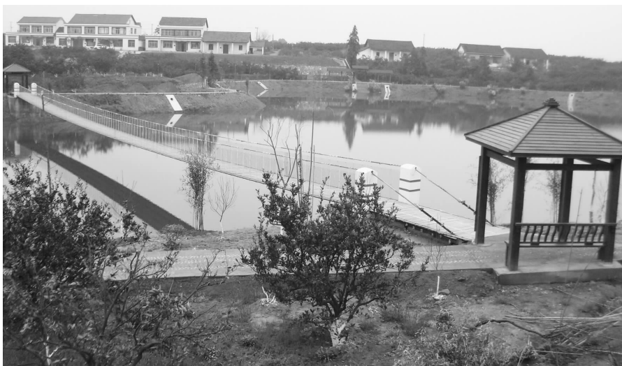
石门县秀坪湖上的吊桥风光

第二,要在建设美丽乡村上有新作为。 美丽乡村建设涵盖基础设施、产业发展、生态环境、公共服务、乡村文化等内容,是一项系统性、长期性的民生工程。因此我们要把美丽乡村建设作为“三农”工作的主题,基本思路是:以村民富、村庄美、村风好为总体要求,以村强民富生活美、村庄宜居环境美、村风文明行为美、村稳民安和谐美、公共服务一体化“四美一化”为建设标准,以“百村示范、千村创建、村村整治”行动为推动路径,力争三年内(2014年起)全市建成300个美丽乡村,其中重点建好100个市级美丽乡村示范村。一是在百村示范上有突破。大力推进100个市级美丽乡村示范村建设,确保到明年都基本建成美丽乡村;突出抓好秀坪、太阳谷、维回新村、牌楼村、出口洲村等重点示范村的建设,将其尽快打造成常德亮点和样板;将美丽乡村适度集中在现代农业示范区和市县城郊,在市城郊重点抓好十大宜游美丽乡村建设;积极探索创新美