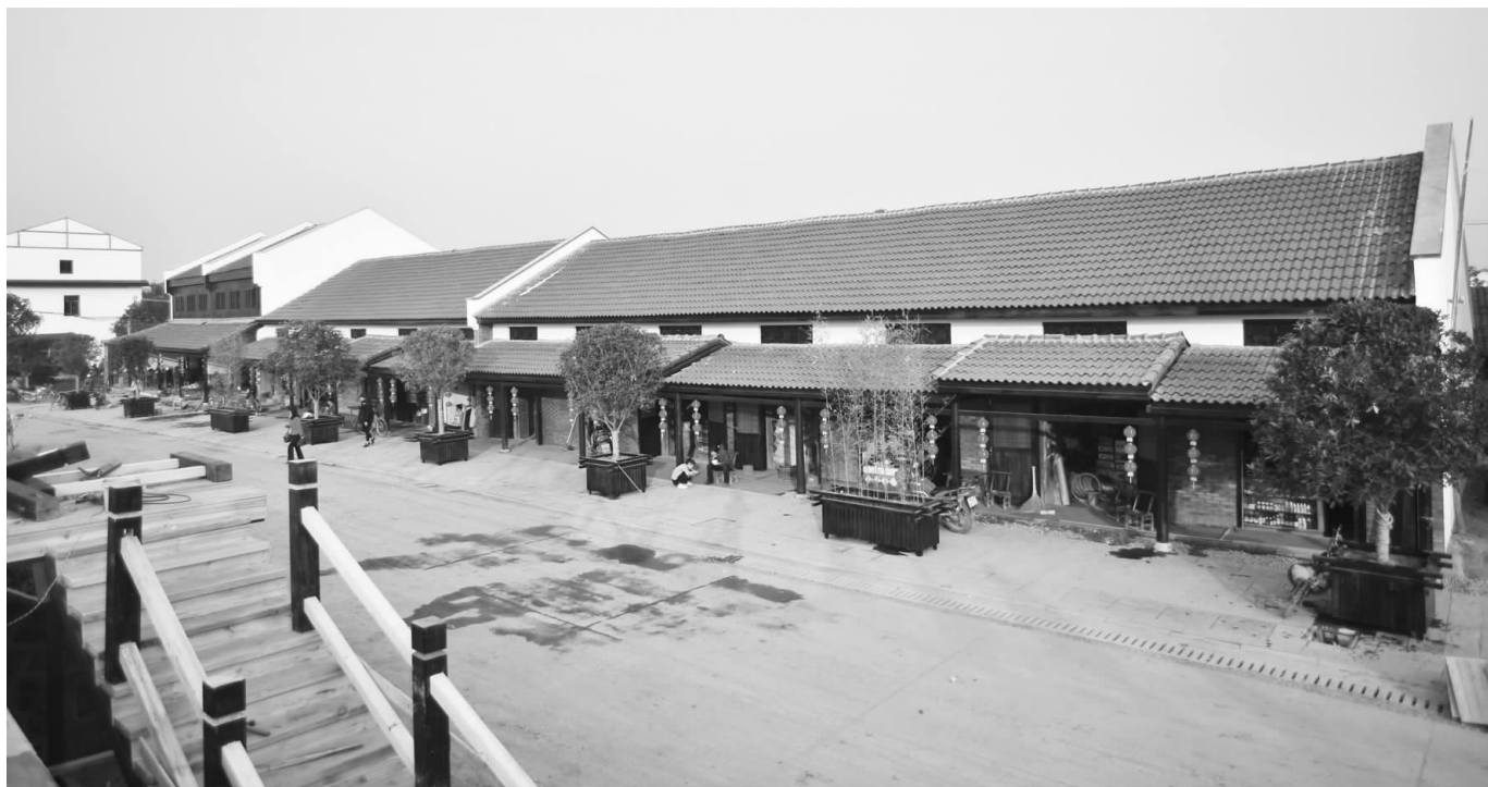
柳叶湖茶盐老街掠影

村土地承包经营权确权登记颁证工作,巩固扩大试点成果,积极稳妥地全面推开这项。要引导农村土地流转,全面建立“一个平台、三大体系”,促进适度规模经营,土地流转过程中一定要尊重农民意愿,不得强制推动。根据上级部署探索开展农村土地征收、集体经营性建设用地入市及宅基地制度改革试点。二是构建农业新型经营体系。这方面主要是在坚持和完善农村基本经营制度、坚持农民家庭经营主体地位的前提下,发展新型农业经营主体,发展多种形式的适度规模经营,提高农民组织化程度,主要是发展家庭农场和农民合作社,以家庭农场为核心、以专业户为主体的合作社将是我国农业发展的重要趋势。三是推进农村金融体制改革。积极探索新型农村合作金融发展的有效途径,稳妥开展农民合作社内部资金互助试点。做好承包土地的经营权和农民住房财产权抵押贷款试点工作,去年我市率先全省开展了相关试点,要继续巩固扩大成果。大力发展政府支持的“三农”融资担保和再担保机构,充分发挥现代农业投资公司融资担保作用。四是稳妥推进农村集体产权制度改革。探索农村集体所有制有效实现形式,确认集体经济组织成员身份,明晰集体资产权属关系,赋予农民对集体资产股份的权能,激活农村各类生产要素,建立符合市场经济要求的农村集体经济运行新机制。五是抓好乡村治理机制创新。扩大以村民小组为基本单元的村民自治试点,规范村“两委”职责和村务决策管理程序,全面建立完善“两委三会”制,抓好“3+X”创新试点,激发农村社会组织活力。