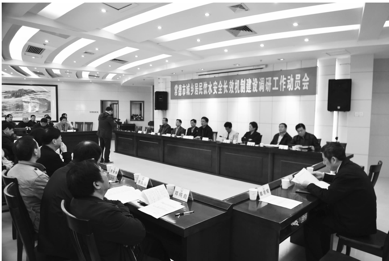
3月23日,常德市城乡居民饮水安全长效机制建设调研工作动员会在市人大常委会机关召开。

一年过去了,全市城乡居民饮水安全工作进展如何?有哪些经验做法和典型事迹?存在哪些问题?如何进一步建立城乡居民饮水安全长效机制?本刊推出“建设‘一号工程’落实‘一号议案’”专栏,对这项民生工程进行深入报道。